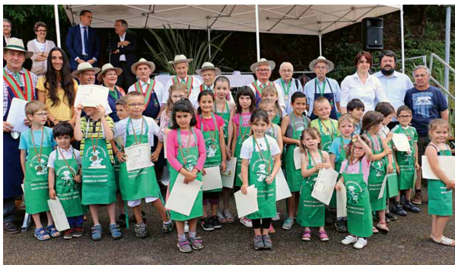
Intronisation des enfants au titre de Jeunes pousses, Sentier botanique de Cours-la-Ville

sante, liée au jardin, entre autres de nombreuses écoles participant au concours de fleurissement «Graines de l'Ain».