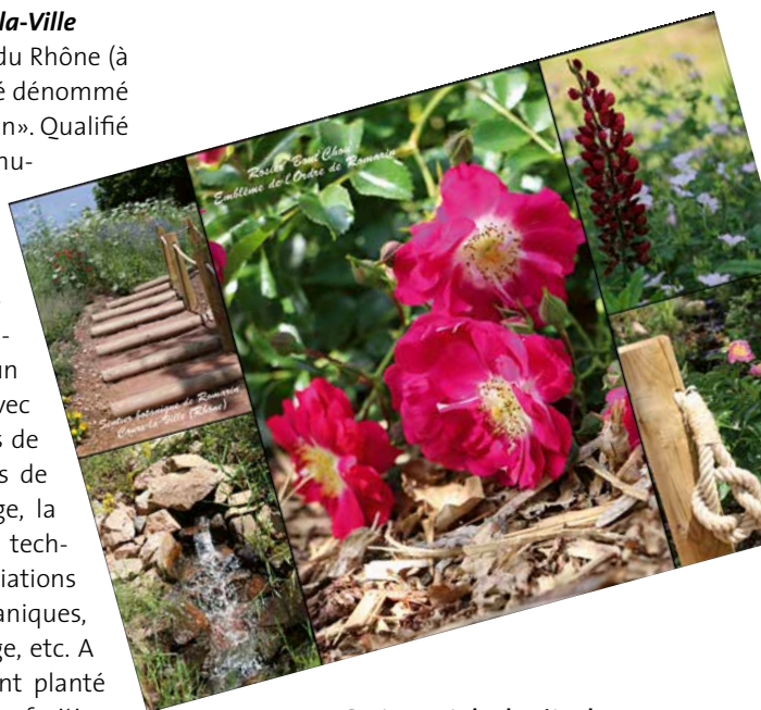
Carte postale du site du Sentier botanique de Cours-la-Ville réalisée par Jean-Luc Girerd

Réalisé dans le département du Rhône (à 70 km de Lyon), ce projet a été dénommé «Sentier Botanique de Romarin». Qualifié de «projet évolutif d'écologie humaniste», il a été créé en 2014 et inauguré en juin 2015. Il concrétise ainsi pleinement la mission de l'association puisque ce projet collectif a été conduit dans un esprit totalement associatif avec comme partenaires les écoles de Cours-la-Ville, les enseignants de sciences naturelles du collège, la municipalité, les services techniques de la ville, des associations locales mycologiques et botaniques, des professionnels du paysage, etc. A l'automne 2015, des élèves ont planté un verger d'une vingtaine de fruitiers dans le cadre de la COP21. En 2016, ce sont des ruches qui ont été installées à proximité du verger et pour cette année 2017, la pose de nichoirs est en cours, toujours avec le concours des écoles. Et déjà de nouveaux projets sont en gestation pour la suite. La gestion du sentier se fait sous l'égide d'une association locale dyna-